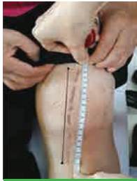
일반 무릎인공관절 수술의 피부절개 : 17CM