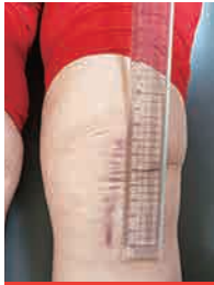
최소 침습 무릎인공관절 수술의 피부절개 : 7CM

정재훈 병원장 : MIS TKR 세계 최다 기록 인증 (미국 WRA EU OWR 대한민국 최초 동시인증)